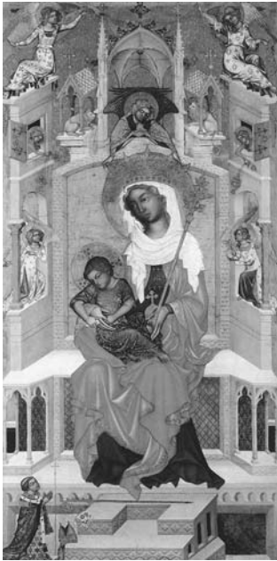
図1 ボヘミアの画家《グラーツの聖母子》1343-44年、186×95 cm、ベルリン、国立絵画館