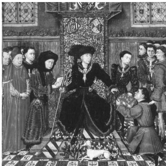
図7 《フィリップ・ル・ボンへの献呈》『ジラール・ド・ ルシヨンの物語』1448年、ウィーン、国立図書館、 Cod.2549, fol.6 r.