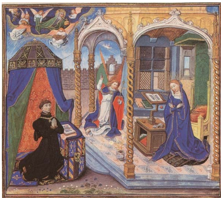
図 12 《受胎告知と祈禱者フィリップ・ル・ボン》『天使祝詞論』1461 年、ブリュッセル、王立図書館、ms. 9270, fol.2 v.