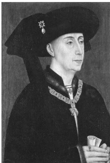
図6 ロヒール・ファン・デル・ウェ イデン (コピー)《フィリップ・ ル・ボンの肖像》1475年頃、 32.5×22.4 cm、ブルッヘ、市立 美術館