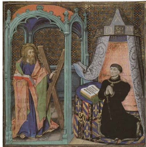
図11 《聖アンドレと祈祷者フィリップ・ル・ボン》『フィリップ・ル・ボンの聖務日課書』ブリュッセル、王立図書館、Ms.9511, fol.398 r.