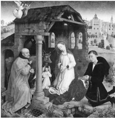
図3 ロヒール・ファン・デル・ウェイデン《ブラーデリンの祭壇画》(中央パネル) 15世紀半ば、ベルリン、国立絵画館