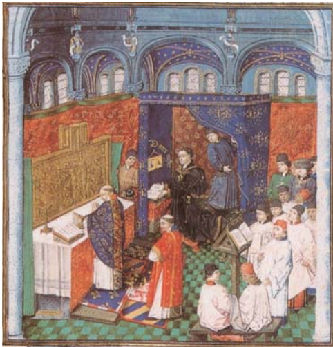
図10 《祈祷者フィリップ・ル・ボン》『主の祈りについての論』1457年以降、ブリュッセル、王立図書館、ms.9092, fol.9 r.