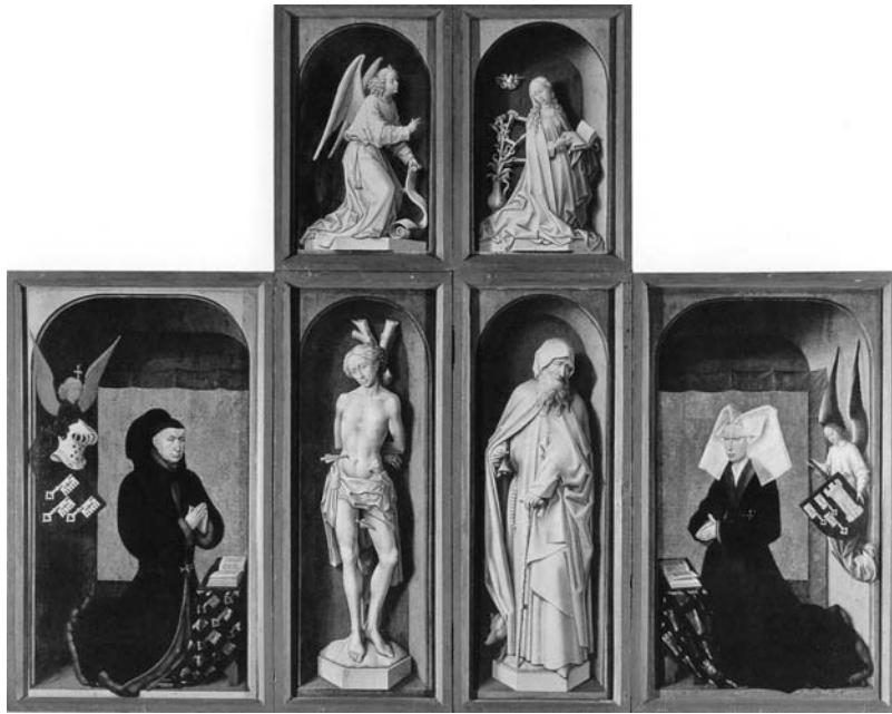
図 22 ロヒール・ファン・デル・ウェイデン 《ボースの祭壇画》外翼、1450 年前後、ボース、施療院