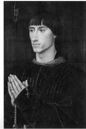
図4 ロヒール・ファン・デル・ウェイデン《ド・クロワの二連画》49×31 cm、サン・マリノ、ハンティントン図書館 (左翼) / 49×30 cm、アントウェルペン、王立美術館 (右翼)