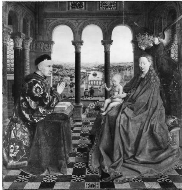
図2 ヤン・ファン・エイク《ロランの聖母子》1430年代中頃、66×62 cm、パリ、ルーヴル美術館