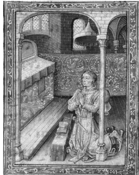
図 17 《祈祷者フィリップ・ル・ボン》『フィリップ・ル・ボンの時祷書』1450-60年代、ハーグ、王立図書館、Ms 76, F 2, fol.44 v.