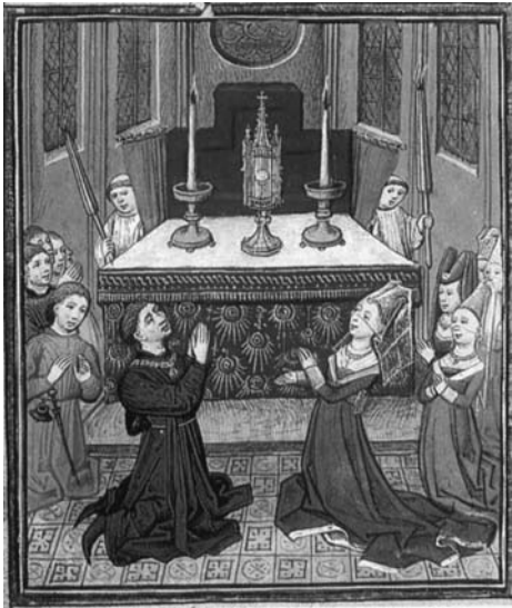
図 14 《祈るフィリップ・ル・ボン夫妻》『フィリップ・ル・ボンの聖務日課書』ブリュッセル、王立図書館、Ms.9026, fol.258 r.