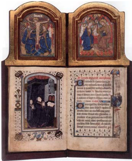
図8 《祈祷者フィリップ・ル・ボン》『フィリップ・ル・ボンの時祷書』1445-50年頃、ウィーン、オーストリア国立図書館、Cod.1800, fol.1 v-2 r.