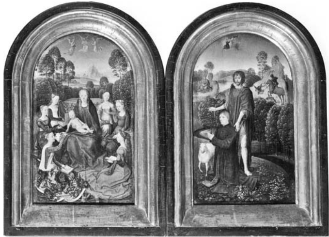
図 24 ハンス・メムリンク《ジャン・ド・スリエの二連画》1475 年頃、各翼 25×15 cm、パリ、ルーヴル美術館