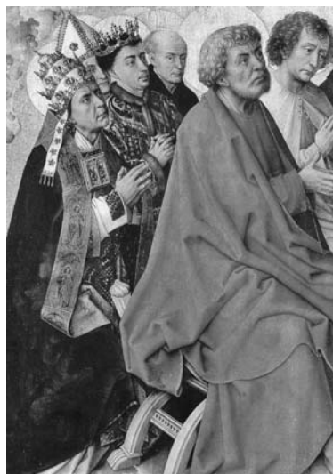
図 21 ロヒール・ファン・デル・ウエイデン《ボースの祭壇画》 (部分) 1450 年前後、ボース、 施療院