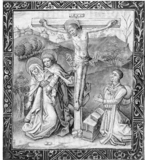
図 15 《磔刑と祈祷者フィリップ・ル・ボン》『フィリップ・ル・ボンの時祷書』1450-60年代、ハーグ、王立図書館、Ms 76, F 2, fol.20 r.