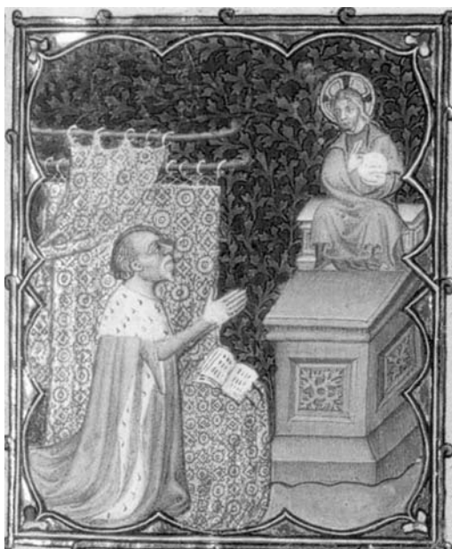
図5 偽ジャックマール・ド・エダン《キリストの像に跪くジャン・ド・ベリー》『ベリー公の小時 祷書』1385-90年頃、パリ、国立図書館、Ms. lat.18014, fol.106 r.