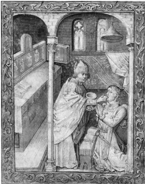
図 16 《聖体を受けるフィリップ・ル・ボン》『フィリップ・ル・ボンの時祷書』1450-60年代、ハーグ、王立図書館、Ms 76, F 2, fol.43 v.