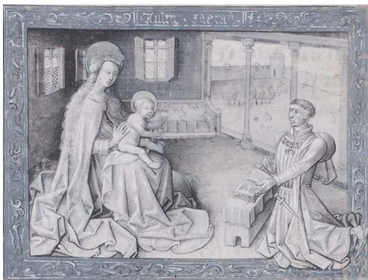
図 13 《聖母子と祈禱者フィリップ・ル・ボン》『フィリップ・ル・ボンの時祷書』1450–60 年代、ハーグ、王立図書館、Ms 76, F 2, fol.299 r.