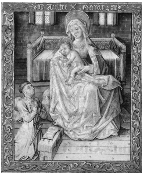
図 18 《聖母子と祈禱者フィリップ・ル・ボン》 『フィリップ・ル・ボンの時祷書』 1450 -60 年代、ハーグ、王立図書館、Ms 76, F 2, fol.48 v.