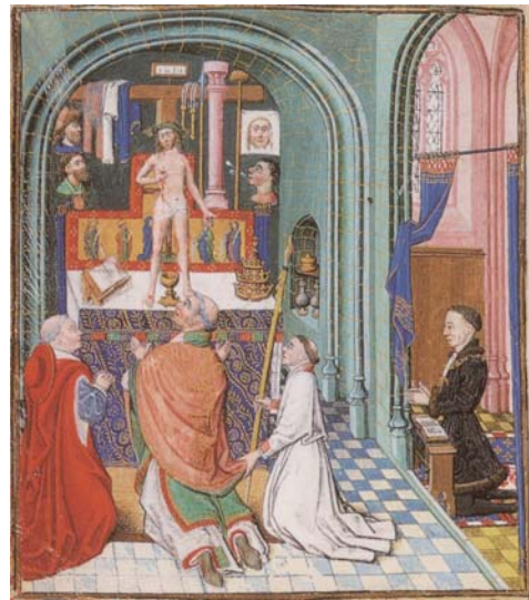
図9 《聖グレゴリウスのミサと祈祷者フィリップ・ル・ボン》『フィリップ・ル・ボンの時祷書』1450-55年、ケンブリッジ、フィッツウィリアム美術館、Ms.3-1954, fol.253 v.