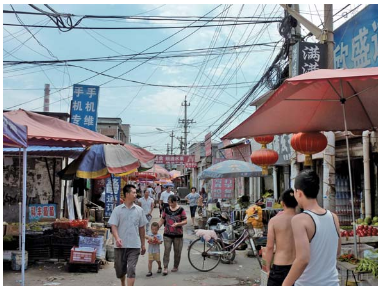
図3 X 組織のある城中村

北京市郊外にあるこの地域はいわゆる「城中村」 (10) と呼ばれる地域であり、都市の中の村と言われている。地域には出稼ぎ労働者人口は 10 万人以上おり、小さなコミュニティの中に雑貨商