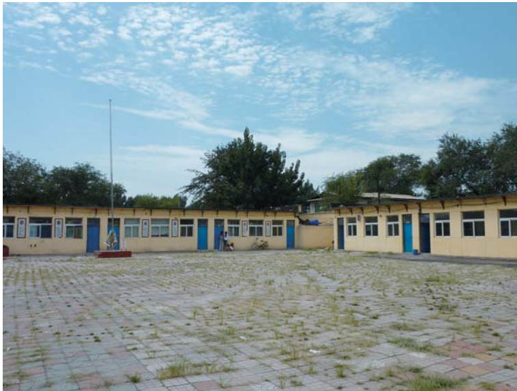
図5 出稼ぎ労働者の子女のための小学校

筆者は、X 組織を運営する親の会が行政や他の組織からの働きかけにより活動をおこなっているのではなく、自ら活動を運営しエンパワメントを発揮している点で、NGO の存在は大きいと考えた。