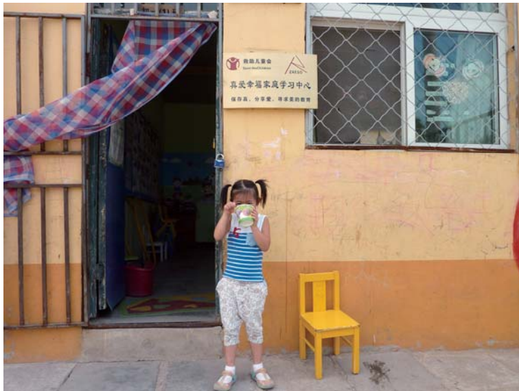
図 4 NGO の概観

施設の活動は、火曜日から日曜日の朝 9 時から午後 5 時まで開放されており、施設内には、保育所のように遊具や絵本などが設置されており、子どもたちはそれぞれ自由に遊んでいる。子どもたちの年齢は、0 歳～16 歳と幅が広く、多いときは 50 人前後の子どもたちが遊びに訪れている。特に受け入れる子どもたちの数に制限はなく、筆者が訪問した際には、乳幼児が母親と一緒に遊びにきており、保育所のような雰囲気では遊びを楽しんでいた。施設内では、保育所のように幼児教育や保育の専門性を持ったスタッフがいるわけではなく、自由な遊び場という雰囲気である。ボランティアの参加も盛んであり、北京大学や清華大学などの大学生が夏休みや、春休みに訪れて子どもたちと時間を過ごしている。施設に通所する児童の年齢の幅が広いいため、小学生や中学生にはボランティアの学生が、宿題をみたり、英語を教えたりと学習の支援もおこなっている。